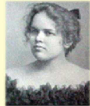
Adelaide Crapsey, creator of the American cinquain.

В начале XX века, форму синквейна разработала американская поэтесса Аделаида Крепси, опиравшаяся на знакомство с японскими миниатюрами хайку и танка . Синквейны вошли в её посмертное собрание стихотворений, изданное в 1914 году.