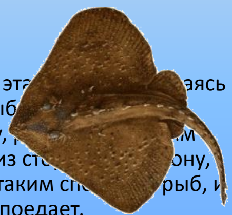
Морская лисица_ в Чёрном море

Вот так чудо, чудеса: и под водой живёт... ЛИСА!