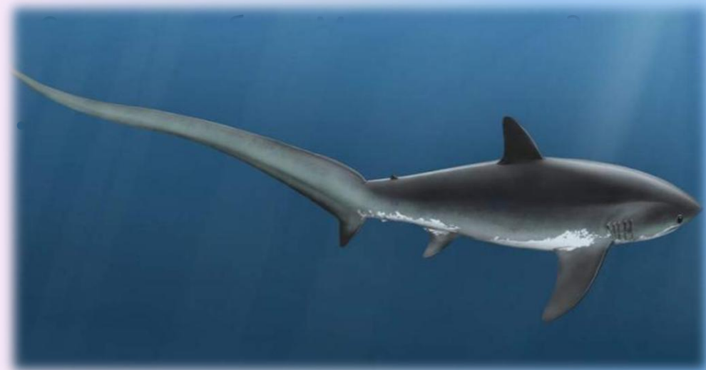
Лисья акула (морская лисица)